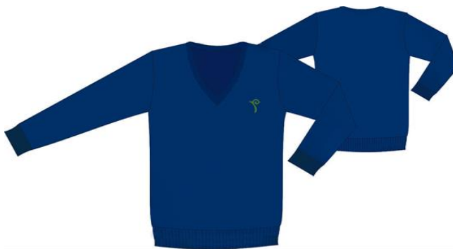
3) спортивная форма